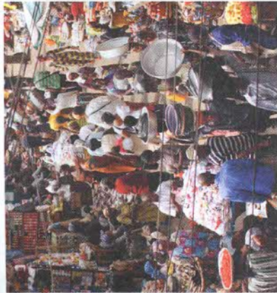
Рис. 138. Люди разных национальностей на африканском базаре