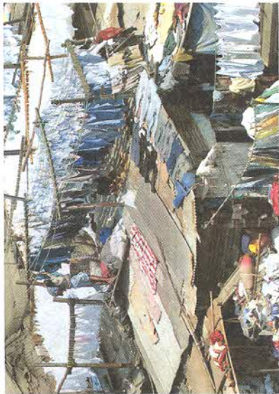
Рис. 139. Прачечная на окраине столицы Танзании — Додома

побережьям океанов. В среднем же плотность населения Африки невелика. Она в два раза ниже среднемирового уровня.