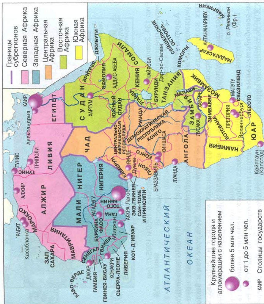
Рис. 135. Субрегионы Африки

оказались разделены государственными границами . В некоторых случаях границы только намечались приблизительно, а иногда их не было вовсе. Это привело к многочисленным территориальным спорам между африканскими странами на современном этапе развития. Поэтому отношения между соседними государствами в Африке могут быть крайне напряжёнными. Такая неблагоприятная политическая ситуация затрудняет решение простых проблем, стоящих перед африканскими странами (рис. 136).