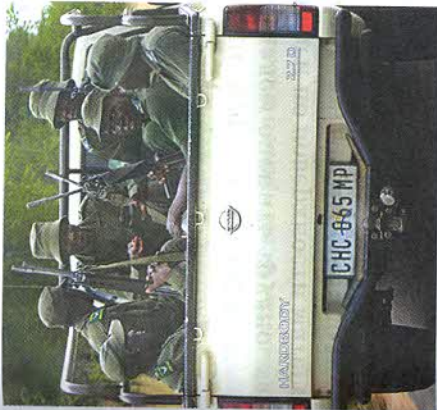
Рис. 136. Политическая ситуация во многих странах Африки напряжённая

Природные ресурсы. Ещё сравнительно недавно Африка была материком, практически неизученным, в том числе и с точки зрения геологической и полезных ископаемых (рис. 137). Исключение составляла южная