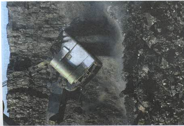
Рис. 157. Открытая добыча каменного угля

Нехватка воды препятствовала развитию земледелия, хотя на плодородных поливных землях получают прекрасные урожаи. Но это при условии решения водной проблемы.