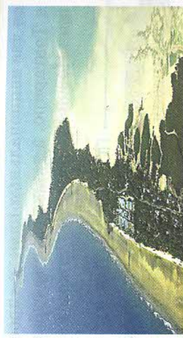
Рис. 162. Баирики — столица государства Кирибати

Новая Зеландия является единственной островной группой Океании, на территории которой есть объекты Всемирного наследия. Здесь находят-