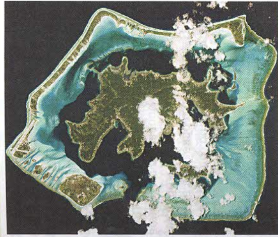
Рис. 160. Остров Бора-Бора (снимок из космоса)

Трудно говорить о лесных и водных ресурсах стран, состоящих из совсем маленьких островков (рис. 160, 161). Лучше просто отметить те виды ресурсов, которые точно есть и которые используются. Это прежде всего рыбные ресурсы океана и рекреационные ресурсы .