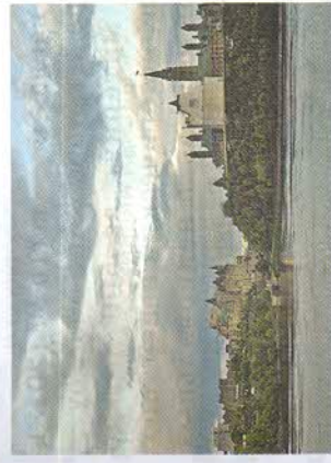
Рис. 105. Столица Канады — Оттава

Хозяйство. Канада — высокоразвитая страна , давно являющаяся членом « Большой семёрки ». В то же время есть некоторые черты хозяйства, которые сильно отличают Канаду от других развитых стран. Прежде всего это явное преобладание отраслей добывающей промышленности . Главные из них: газовая, нефтяная и лесная. Канада является крупным мировым