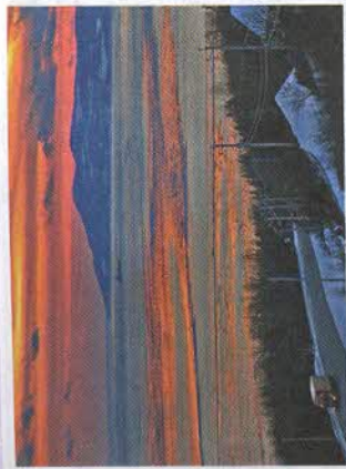
Рис. 104. Канада — северная страна

чивается за счёт продолжающейся миграции в Канаду.