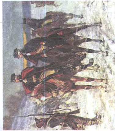
Рис. 107. Генерал Дж. Вашингтон в период Войны за независимость

США — молодая страна, история которой насчитывает менее 250 лет. Появление страны, обьившей себя свободной страной свободных людей, привело к массовой миграции населения из многих европейских стран, прежде всего из Великобритании. Большая часть иммигрантов оставалась в приатлантических штатах, но многие устремились в глубь страны, отвоевывая, занимая и осваивая новые земли (рис. 108). По мере продвижения колонистов на запад в состав США в качестве штатов входили новые территории. Формирование территории США почти