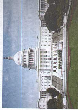
Рис. 109. Капитолийский холм в Вашингтоне. Здание Парламента

Страна лежит в южной части умеренного и в субтропическом климатических поясах. Следовательно,