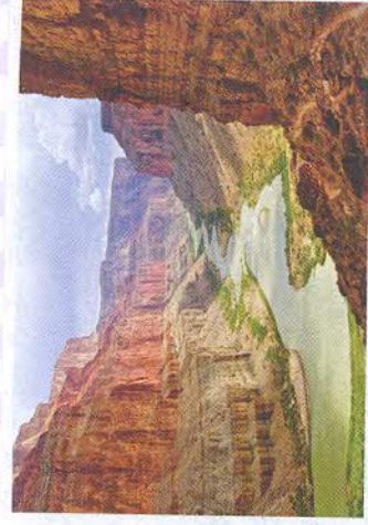
Рис. 110. Гранд-Каньон. В США считают, что тот, кто его не видел, не настоящий американец

США — молодая страна, поэтому историко-культурных объектов Всемирного наследия в ней относительно немного. Большинство из них являются памятниками природы. Среди немногих историко-культурных памятников самым знаменитым, несомненно, является статуя