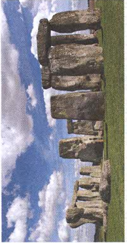
Рис. 75. Стоунхендж — доисторическое культовое сооружение (Великобритания)

полный набор отраслей хозяйства. Основа хозяйственной жизни здесь — мощная нематериальная сфера, а также современная промышленность и интенсивное сельское хозяйство.