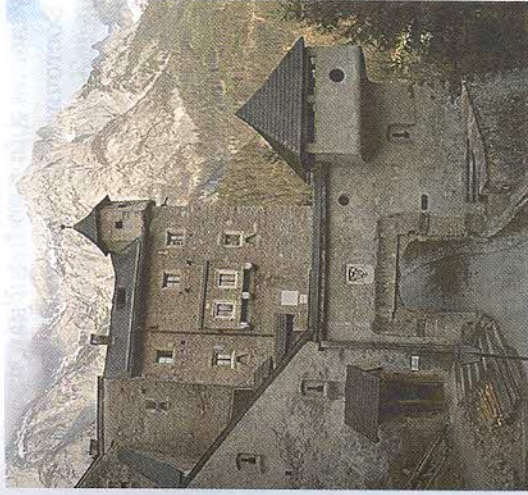
Рис. 76. Исторический центр Зальцбурга (Австрия)

Южная Европа — колыбель европейской цивилизации. Не случайно, что именно здесь сосредоточено более 2/3 всех объектов Всемирного наследия Европы. Из них в Италии находится 49 (рис. 77). Это больше, чем в любой другой стране мира. В Южной Европе расположены памятники Античности: афинский Акрополь, археологические объекты в Дельфах, Микенах, Олимпии (Греция), римский Колизей (Италия). Памятниками