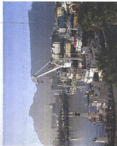
Рис. 154. Кейптаун — крупнейший порт ЮАР

та приходилось 20% экспорта. Другие экспортные товары — углеродные концентраты (в том числе урановые), алмазы . Страна импортирует машины и транспортное оборудование, нефть, продовольственные товары. Основные торговые партнёры ЮАР — Германия, США, Великобритания и Япония.