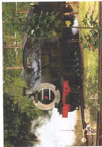
Рис. 142. Этому паровозу около ста лет

Обрабатывающая промышленность представлена только традиционными для Африки отраслями лёгкой (рис. 141) и пищевой промышленности да редкими пока химическими и металлургическими предприятиями. В последние годы получила развитие нефтепереработка.