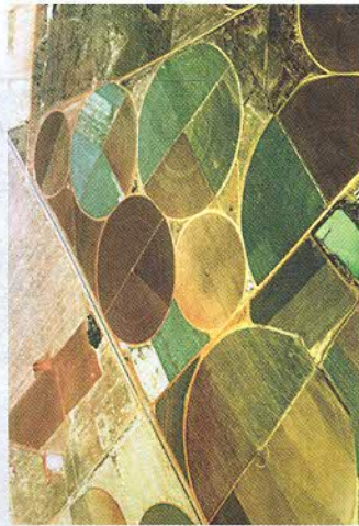
Рис. 153. Поливное земледелие