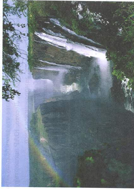
Рис. 146. Водопад Виктория считают одним из красивейших в мире