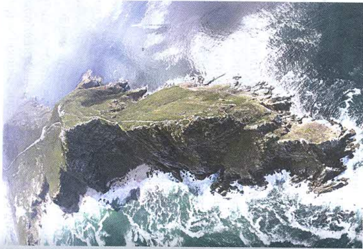
Рис. 148. Мыс Доброй Надежды. В его окрестностях появилось первое голландское поселение в Африке

В 1806 г. колония была захвачена Великобританией, и буры ушли от побережья на север и там, в глубине материка, на отвоеванных у местного населения землях, основали две новые колонии: республики Оранжевая и Трансвааль .